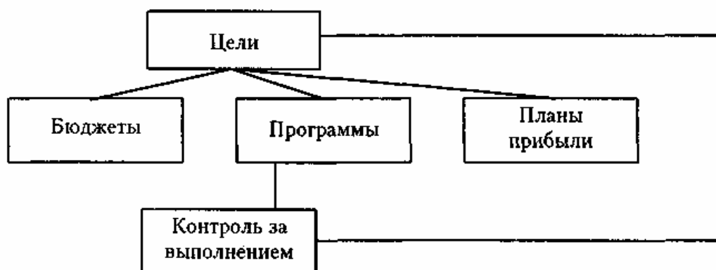
Схема долгосрочного планирования

высшее руководство определяет цели каждому подразделению, а последнее разрабатывает количественные планы достижения этих целей методом "снизу вверх".