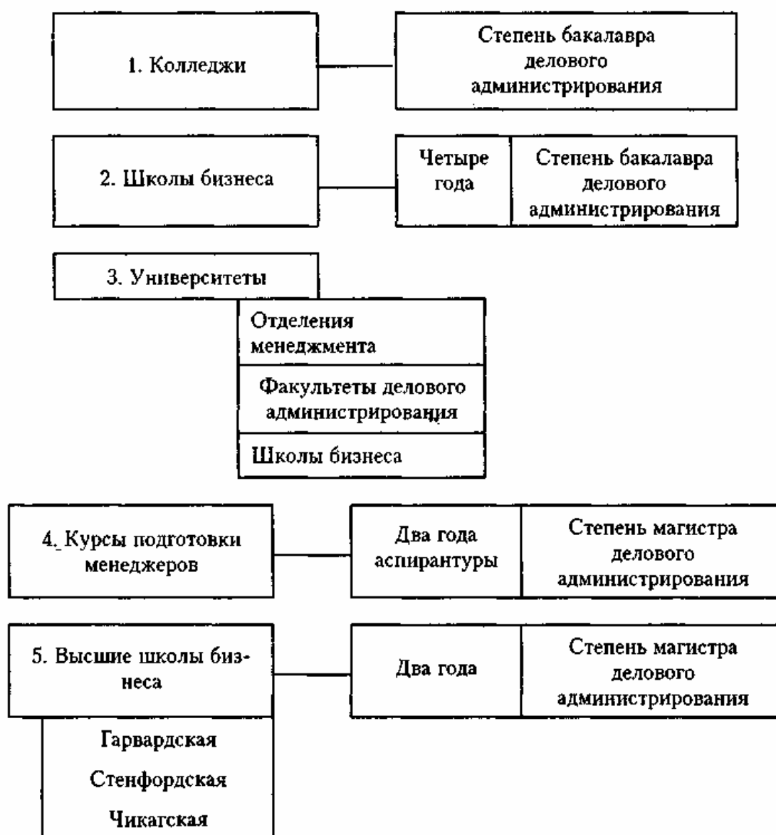
Система подготовки кадров менеджеров в США

Японские фирмы тратят на обучение в расчете на одного занятого в три-четыре раза больше, чем американские. В Японии непрерывное образование является частью процесса труда, на который каждый занятый тратит примерно 8 часов в неделю, в том числе 4 часа за счет рабочего времени и 4 часа - за счет личного.