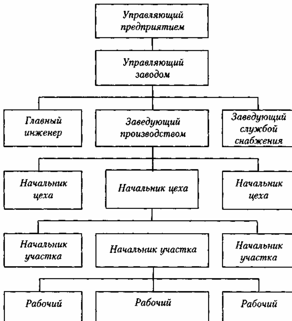
Схема производственной структуры предприятия

Возглавляет цех начальник, который руководит им, организует производственный процесс и отвечает за его деятельность. В управлении производством начальнику цеха помогают начальники участков, мастера, руководители цеховых бюро и служб. Аппарат управления цехов и участков состоит, как правило, из производственно-диспетчерского бюро, группы по организации и нормированию труда, экономиста, бухгалтера и др.