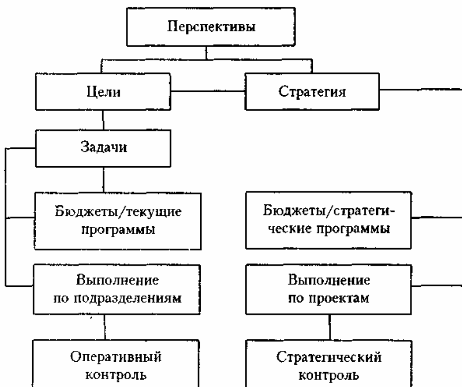
Схема стратегического планирования

Стратегический план выражен стратегией корпорации. В нем содержатся решения относительно сфер деятельности и выбора новых направлений. В нем могут перечисляться основные проекты и задаваться их приоритеты. Разрабатывается он на уровне высшего звена управления. Обычно стратегический план не содержит количественных показателей.