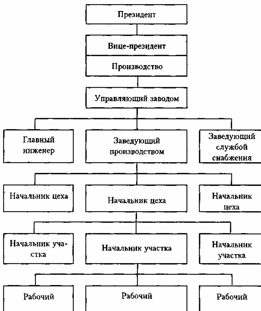
Рис. 22.1. Структура управления производством в американских фирмах